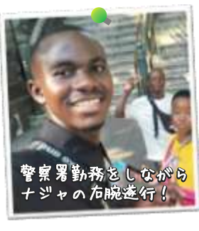
サブディレクター カシアーン