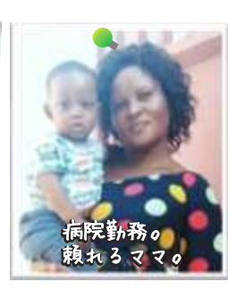
衛生・調理 エスタ