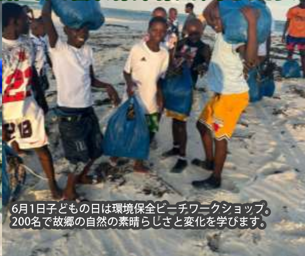
6月1日子どもの日は環境保全ビーチワークショップ。 200名で故郷の自然の素晴らしさと変化を学びます。