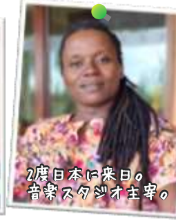
音楽スタジオ オズバルド