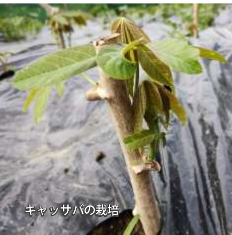
キャッサバの栽培