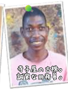
寺子屋施設管理 タニム