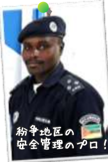
安全管理 ジョルダン