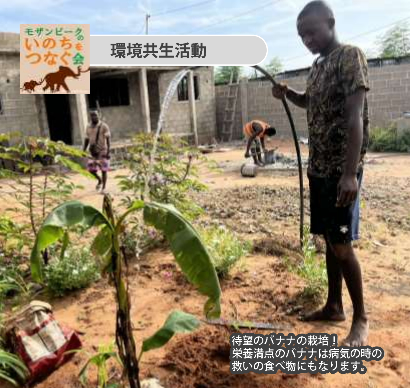
待望のバナナの栽培！ 栄養満点のバナナは病気の時の 救いの食べ物にもなります。