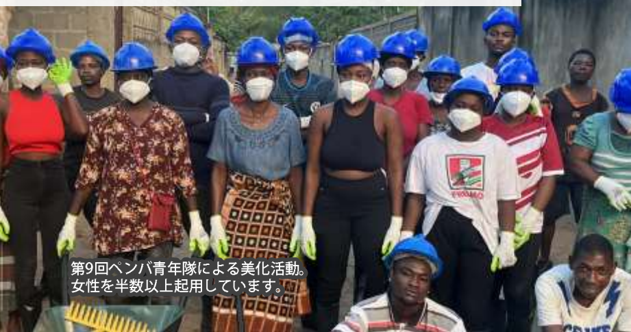
第9回ベンバ青年隊による美化活動。 女性を半数以上起用しています。

廃プラが海に流れ込む。路地にゴミが積み上がる。開発が進むにつれ、産業廃棄物まで流れ込むようになった。 学校に環境教育はない。文句を言っても何も変わらない。 だから自分たちで、自分たちの町をきれいにする。子どもたちに、地球のことを教える。 美化委員33名が路地とビーチを清掃し、子どもたちが廃プラでものを作り、海を学ぶ。 美しい故郷。それは住民の誇り。誇りは、子どもたちの故郷を愛し守るチカラを育む。