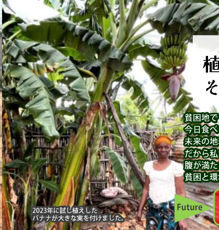
2023年に試し植えた バナナが大きな実を付けました。