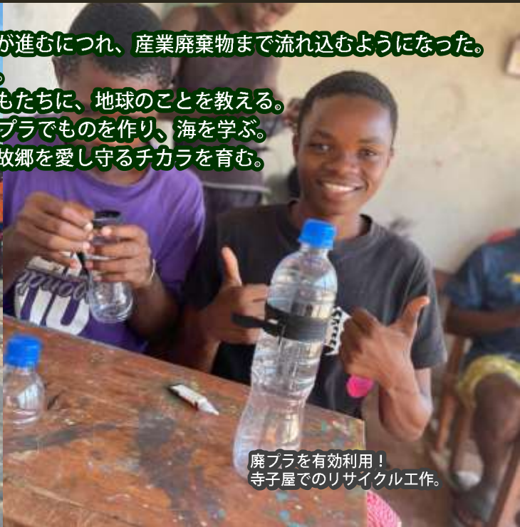
廃プラを有効利用！ 寺子屋でのリサイクル工作。