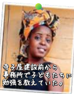
衛生・調理 アリサーヤ