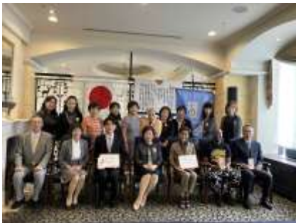
社会ボランティア賞